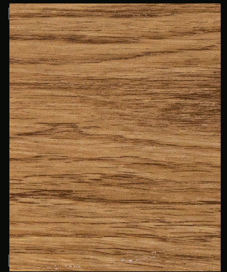
RIGICORE 5.0 / RB-60212 PREMIUM OAK NATURAL