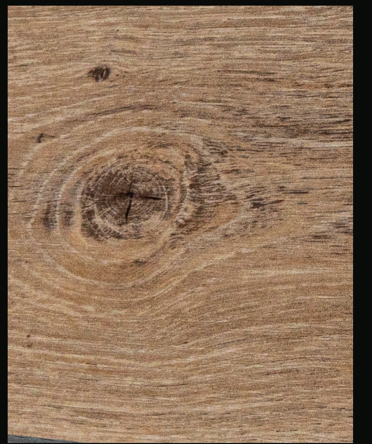
RIGICORE 5.0 / RB-70321 EXCELLENT OAK AGED