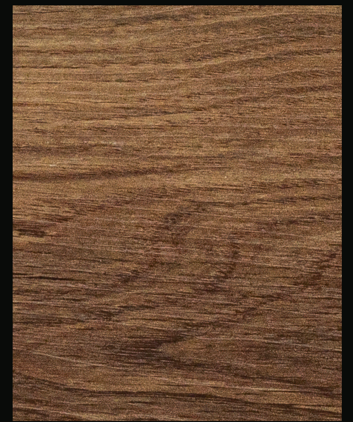
RIGICORE 5.0 / RB-60214 PREMIUM OAK SMOKED