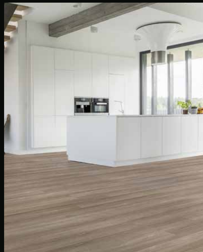
RIGICORE 5.0 / RB-50101