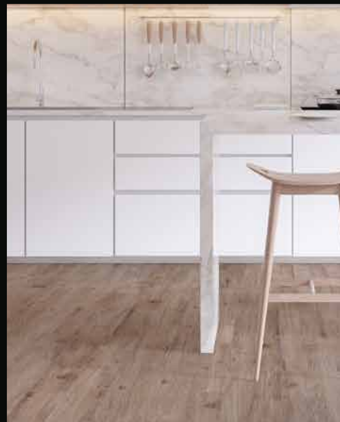
RIGICORE 5.5 / RB-70322